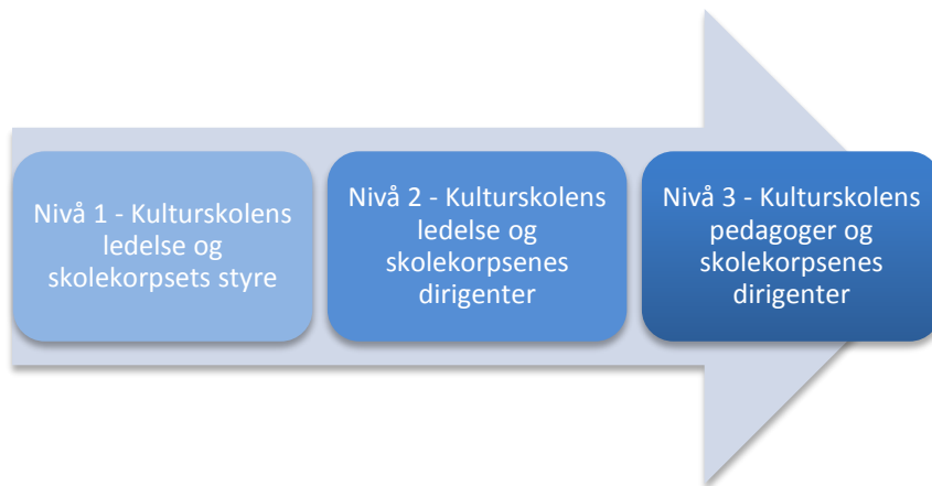
Fig2. Nivårekke for systematisert samarbeid kulturskole og skolekorps

Samhandlingen mellom korps og kulturskole kan skje på ulike måter og med ulikt fokus. Systematikk, klare avtaler, forpliktelse og gjensidig forståelse er imidlertid avgjørende for at det skal fungere på sikt. En metodikk for å etablere en slik samhandling, kan komme i mange former. Under er det skissert ulike nivåinndelte treffpunkter. Hensikten med å dele dette inn i ulike nivåer, er å få til en langsiktig forankring med gode rutiner.